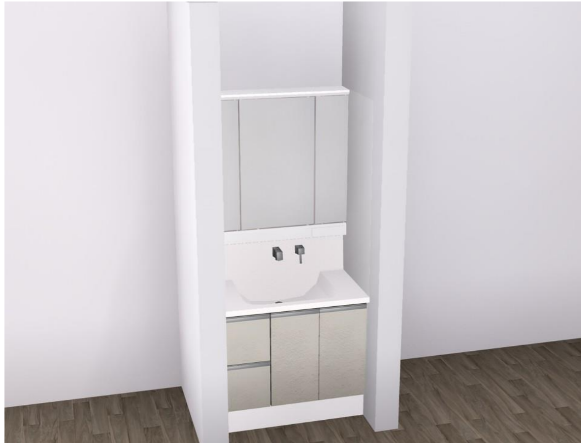
画像はイメージです。